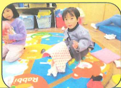
メルちゃんのお世話しているよ