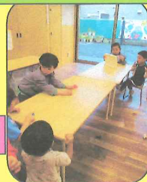
キャップ転がしゲーム